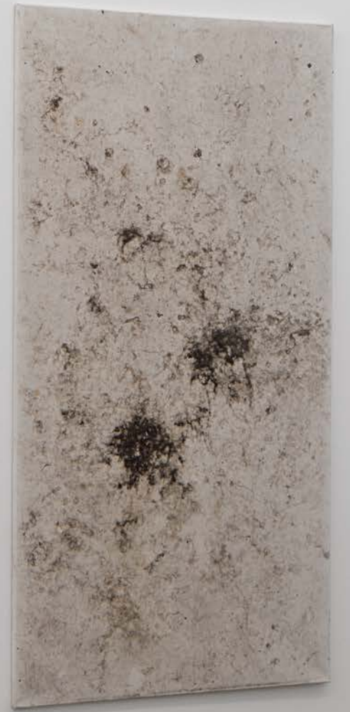
Alice Aycock Walking Stick, 2012