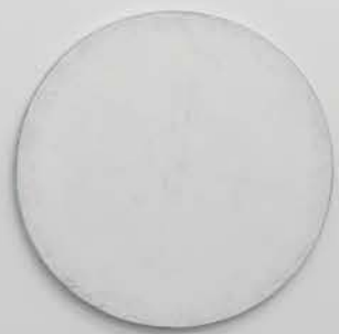
Monica Bonvicini Salt Exercise 09, 2010